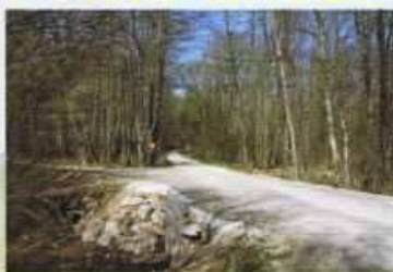
Pont "route forestière"