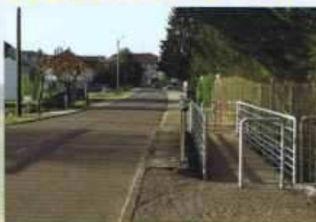
Passerelle "route de la Combeauté"