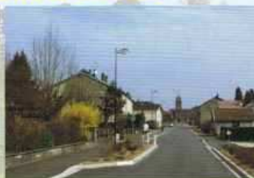
Plantations "rue H. Duhaut"